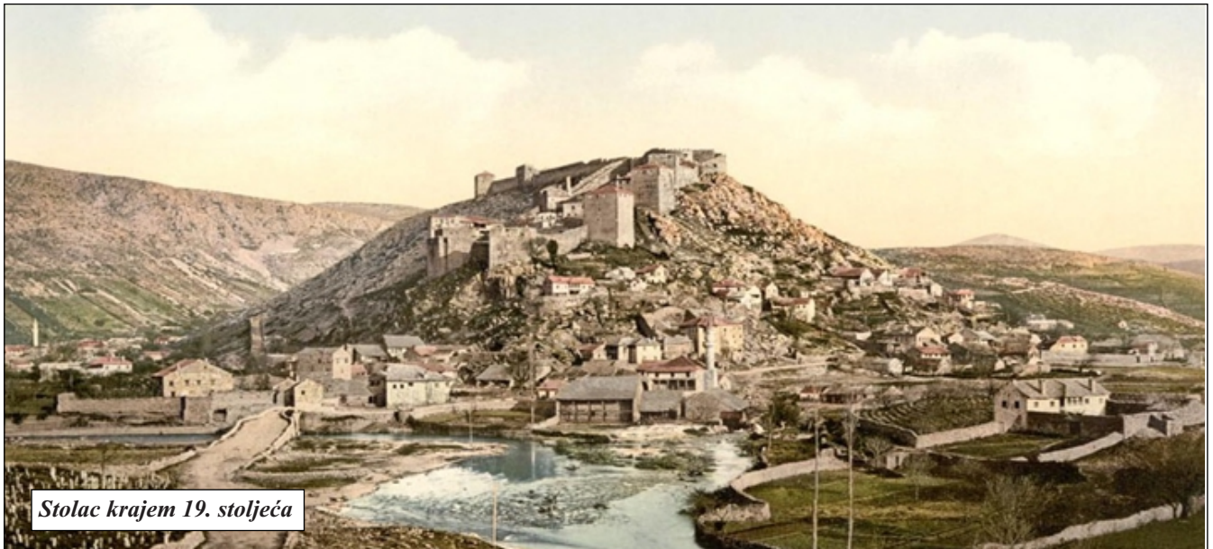
Stolac krajem 19. stoljeća

Mali Stolac je grad mostova ima ih desetak. Grad je u dolini okružen planinom Hrgud i Vidovim poljem. Klima je mediteranska s puno sunca iako bura zna postići brzinu do 120 km/h. Stolac je prepun povijesno-kulturnog i prirodnog bogatstva: pečinski crteži, stari grad, stećci, džamije, mostovi i vodenice (mlinice) na Bregavi. Pod zaštitom UNESCOa je od 1980.