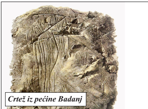
Crtež iz pećine Badanj

Mali Stolac je grad mostova ima ih desetak. Grad je u dolini okružen planinom Hrgud i Vidovim poljem. Klima je mediteranska s puno sunca iako bura zna postići brzinu do 120 km/h. Stolac je prepun povijesno-kulturnog i prirodnog bogatstva: pečinski crteži, stari grad, stećci, džamije, mostovi i vodenice (mlinice) na Bregavi. Pod zaštitom UNESCOa je od 1980.