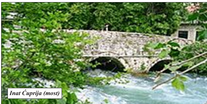
Inat Ćuprija (most)

Koliko vas je posjetilo našu Istočnu Hercegovinu? Ta Hercegovina je, kao i cijela Bosna i Hercegovina, ljepotica s puno povjesnih znamenitosti i prirodnih zanimljivosti.