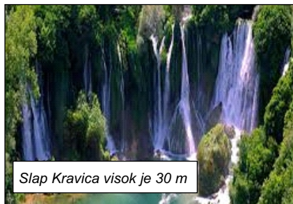
Slap Kravica visok je 30 m