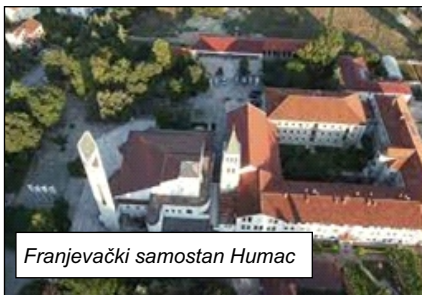
Franjevački samostan Humac

Pokraj župne kuće 1866. godine, nakon dobivanja sultanova odobrenja (fermana) građena je crkva, a dovršena je 1869. Danas je na Humcu nova crkva sv. Ante Padovanskog, koju je 4.10.2021. posvetio mostarski biskup Petar Palić. Na Humcu su dugo godina bili viši razredi franjevačke srednje škole i prve godine filozofsko-teološkog studija. Franjevci su 1876. otvorili pučku školu, a njihovom zaslugom na Humac su došle sestre milosrdnice koje su 1898. otvorile mješovitu osnovnu, a potom i obrtnu žensku školu. U prostorima samostana 1916. otvorena je i Hrvatska seljačka škola za odrasle.